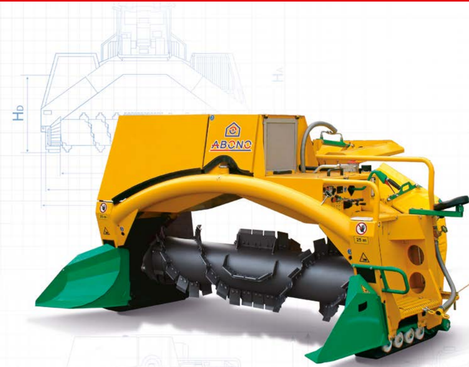
ВОРОШИТЕЛИ БУРТОВ Модель: ABONO-16.30