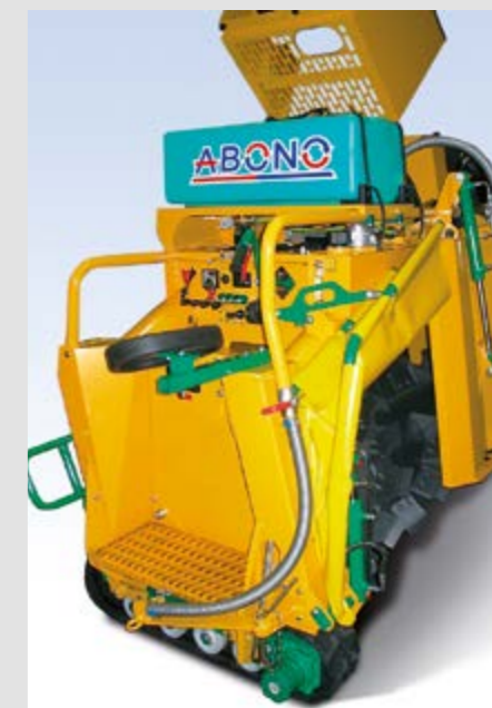
Система увлажнения и внесения ферментов